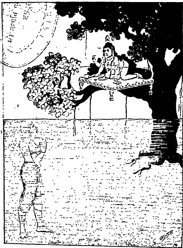
भक्त मार्कण्डेय मुनि